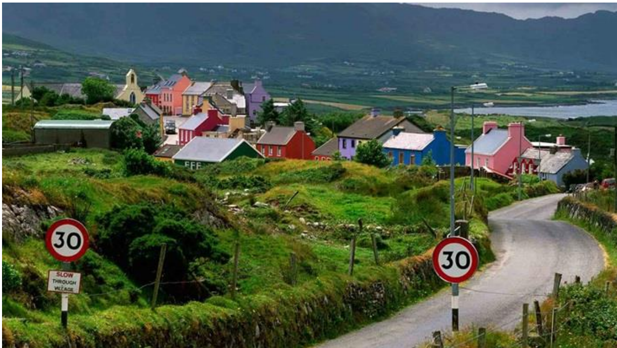
Het dorpje in West-Ierland

Ik vertel dit omdat dit benauwende huwelijk én in de eerste plaats haar verstikkende jeugd in een streng katholiek gezin in een dorpje in West-Ierland een vruchtbare bron zijn geweest voor haar schrijverschap – zoals ze zelf vaak heeft beaamd. Haar doorbraak als schrijver ging met veel ophef gepaard: The Country Girls werd door de Ierse kerk in de ban gedaan, omdat het als immoreel werd bestempeld. Het sprak te openhartig over de ontluikende seksualiteit van jonge meisjes. De boeken werden zelfs eigenhandig verbrand door de pastoor van het dorp waar de O’Briens woonden.